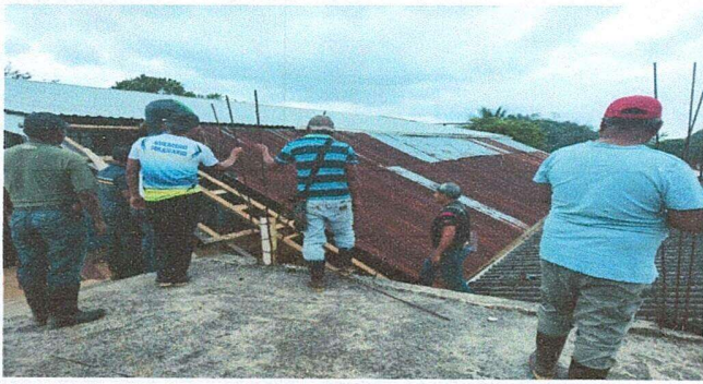
Foto1: Inicio de trabajos de mantenimiento modulo I (dos aulas).