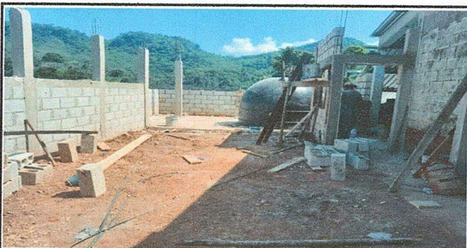
Foto 5: Panoramica de cocina y area de depositos de agua en proceso de mantenimiento.